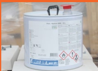
Pieri® Hydroxi 2000 ou similaire

Il a pour objectif de protéger le béton contre les dégradations de surface dues à l'humidité.